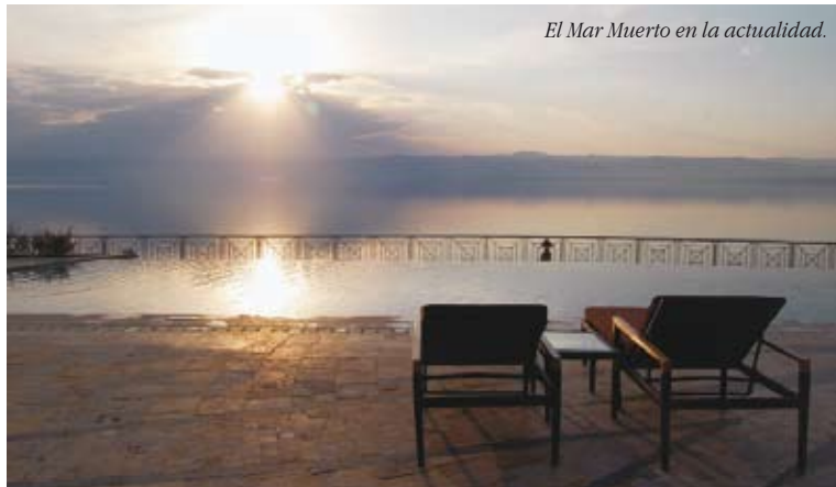
El Mar Muerto en la actualidad.

H oy permanece, como curioso testigo de la historia bíblica del Mar Muerto, una roca con forma de mujer que, según los locales, es la estatua de la esposa de Lot, quien se habría convertido en sal al voltear la cabeza para ver como la ciudad se destruía.