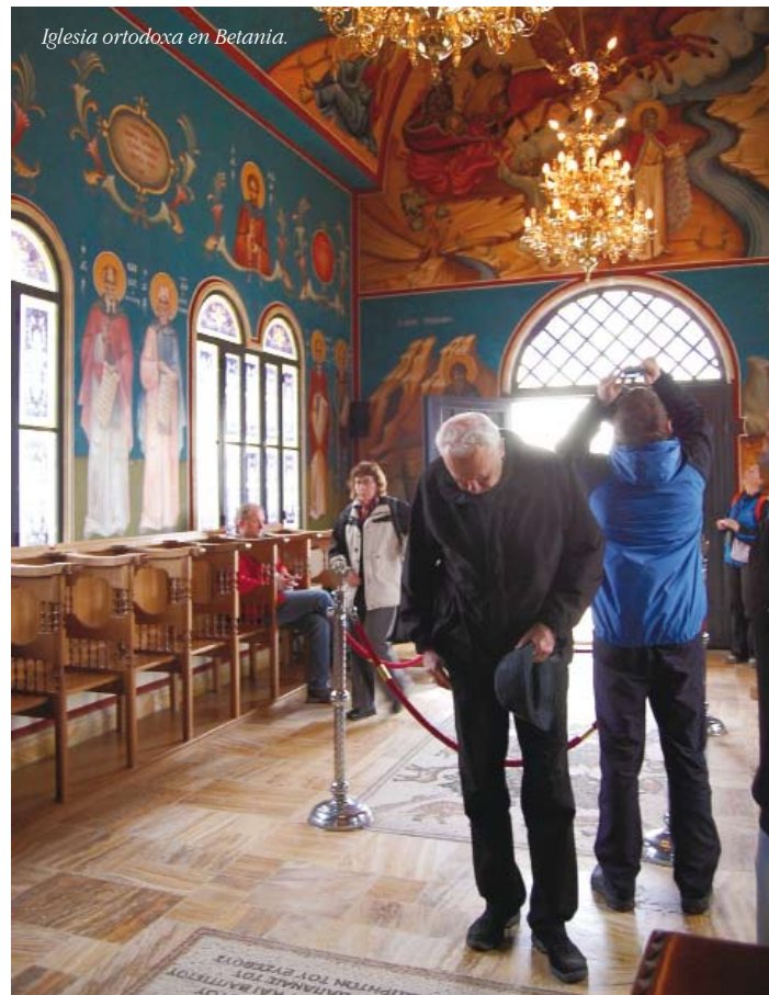
Iglesia ortodoxa en Betania.